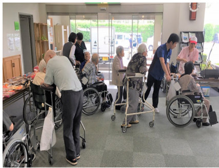
↑ れもん買い物会の風景