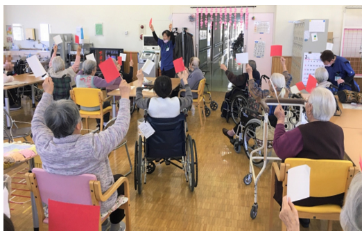
↑ 通所リハビリの様子