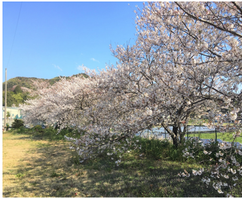
↑ 令和初のグリーン丈六の桜

新型コロナウイルス感染症の影響で、様々な行事等が延期や中止になっていきますね。国内においても多くの死者を出しているコロナウイルス感染症。今は人類が共に「相互扶助の精神」で助け合いながら立ち向かわなければなりません。終息の時期も定かではありませんが、健康に注意し日々