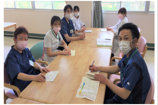
↑ 行事広報委員会の様子