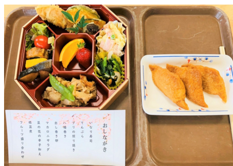
↑ お花見会で提供された食事

ツ」です。菜の花をはじめ季節に応じた旬の食材を用意しました。日々の昼食とは違い、見た目も量も異なる食事に、皆様、舌鼓を打ちながら召し上がっていました。「美味しいな」という声が、あちこちから聞かれ、満開の桜のような笑顔が溢れる楽しい昼食となりました。