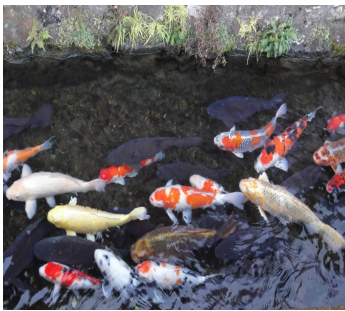
↑ せせらぎロードの様子