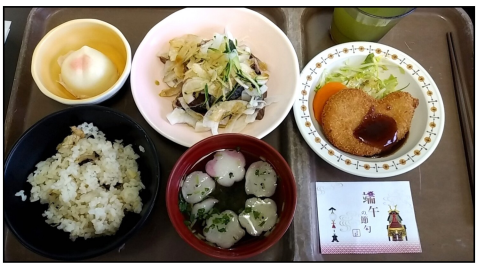
端午の節句(こどもの日)の行事食

ただ今ことが出来ました。五日の夕食には行事食を提供しています。これからも行事と共にご利用者様と触れ合い楽しい時間を過ごして行けるよう頑張っていきたいです。