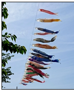
風の向きや強さによって鯉のぼりの見せる表情も千差万別。大きいものは6mになります。

感じますね。江戸時代に誕生したといわれる鯉のぼりは、当初は黒の真鯉のみでした。明治時代に緋鯉が加わり、その後、昭和時代から青や緑などの子鯉を加え、家族を表しているようになりました。例えば、黒の真鯉はお父さん、赤の緋鯉はお母さん、青が長男、緑が次男、長女にはピンクやオレンジといった感じですが昔は家族が増えるたびに鯉のぼりを増やしていく家庭が多かったようです。鯉のぼりが優雅に泳いでいるのを見ると「幸せだなあ」「平和だなあ」という気持ちになります。