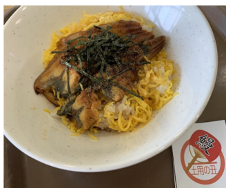
昨年の土用の丑の日の行事食

七月二十八日は土用の丑の日です。日本では丑の日を特別な日とする習慣があり、特に梅雨明けの夏の土用の丑の日は重要な日と言われています。この日に体をいたわり精が付くものを食べる。このため、うなぎを食べる風習が始まったそうです。かの平賀源内が始めたそうです。