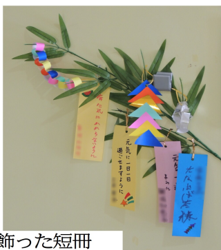
居室前に飾った短冊

短冊には「家族が元気でいられますように」とご家族の幸せを願っているものや「孫に会えますように」といった、昨今のコロナ禍だからこそ願ひなど、様々なものがありました。一番多かった願ひ事は「元気になるたい」次いで、「家族に会いたい」、「美味しいものが食べたい」でした。七月七日の昼食には行事食としてミニ散らし寿司、そうめん、天ぷら、小松菜のごま和え、メロン