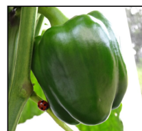
左下にテントウム虫が見えます