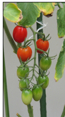
収穫が楽しみです