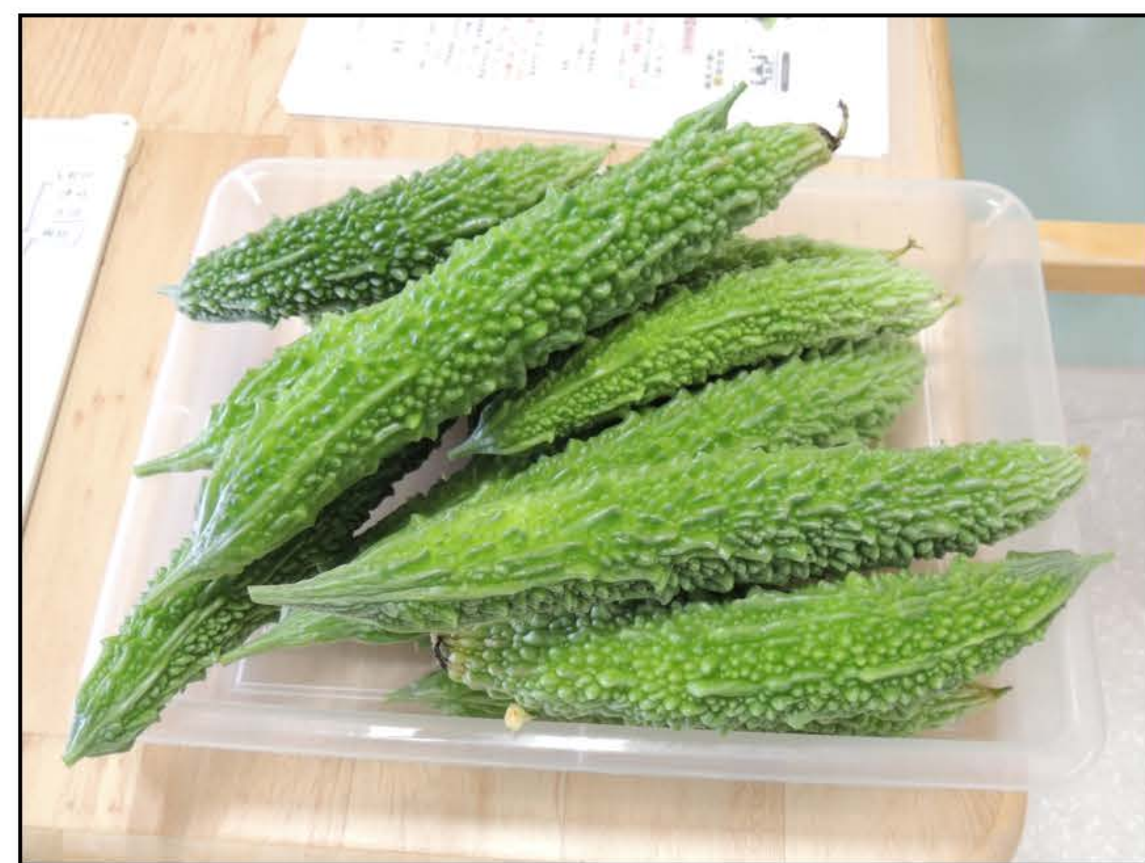
グリーン丈六で採れたゴーヤ

緑のカーテンには様々な効果があります。それこそカーテンのように無数の葉が直射日光を遮り、室温の上昇を抑えます。室温が下がると省エネにもなります。また、植物が育っていく過程を観察できたり、ゴーヤの収穫も楽しめます。 7月に入り、ゴーヤの花が咲き、実がなるようになると、利用者の皆様が窓の外を観察している姿がよく見られるようになってきました。席からはよく見えないからと窓際に近づき、立った姿勢で観察される利用者様もいらっしゃいます。立つ訓練をしていらっしゃる方なので、ゴーヤを見ることが体力強化に繋がるといっては新しい