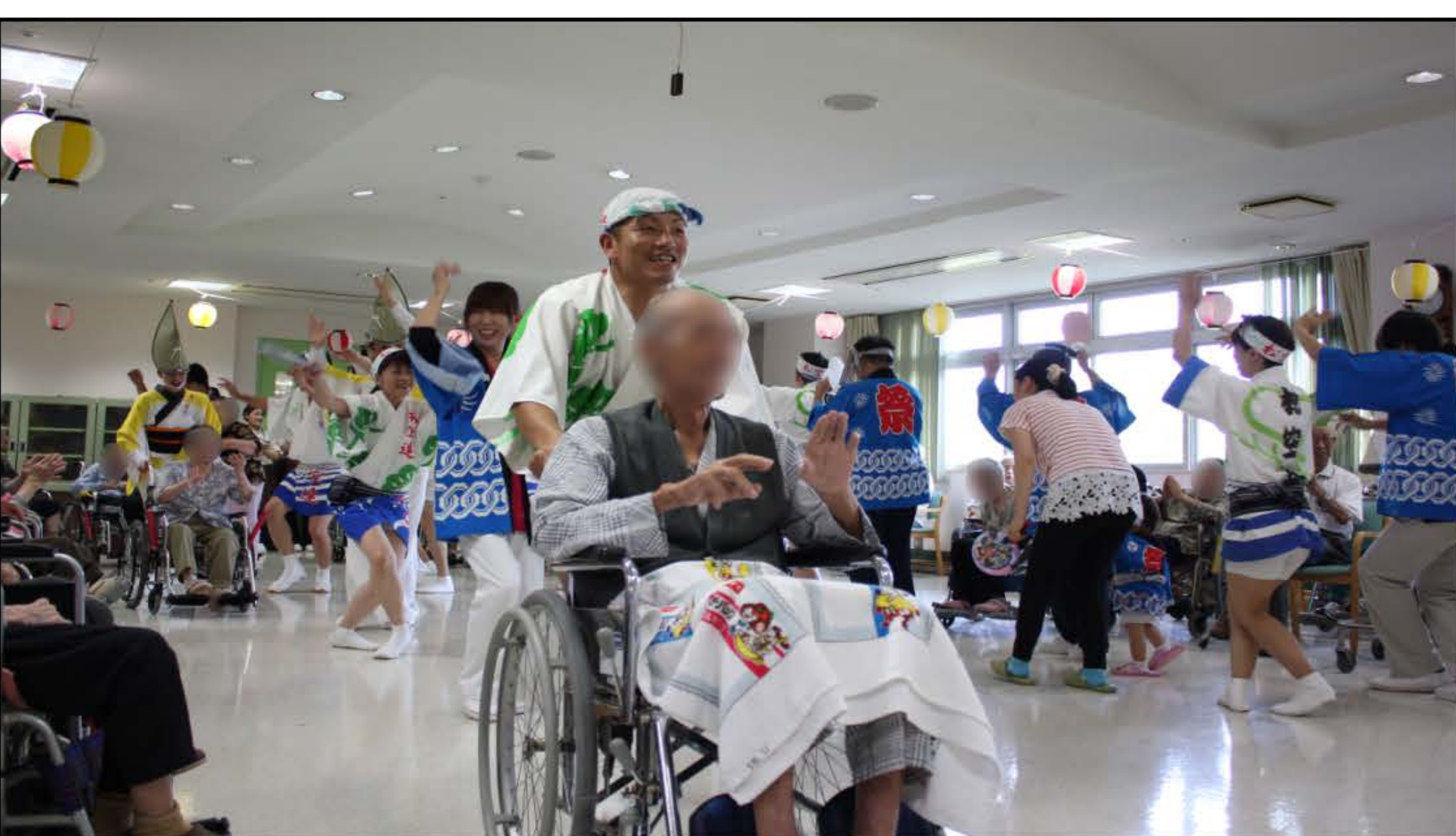
松空連の方々と一緒に阿波踊り