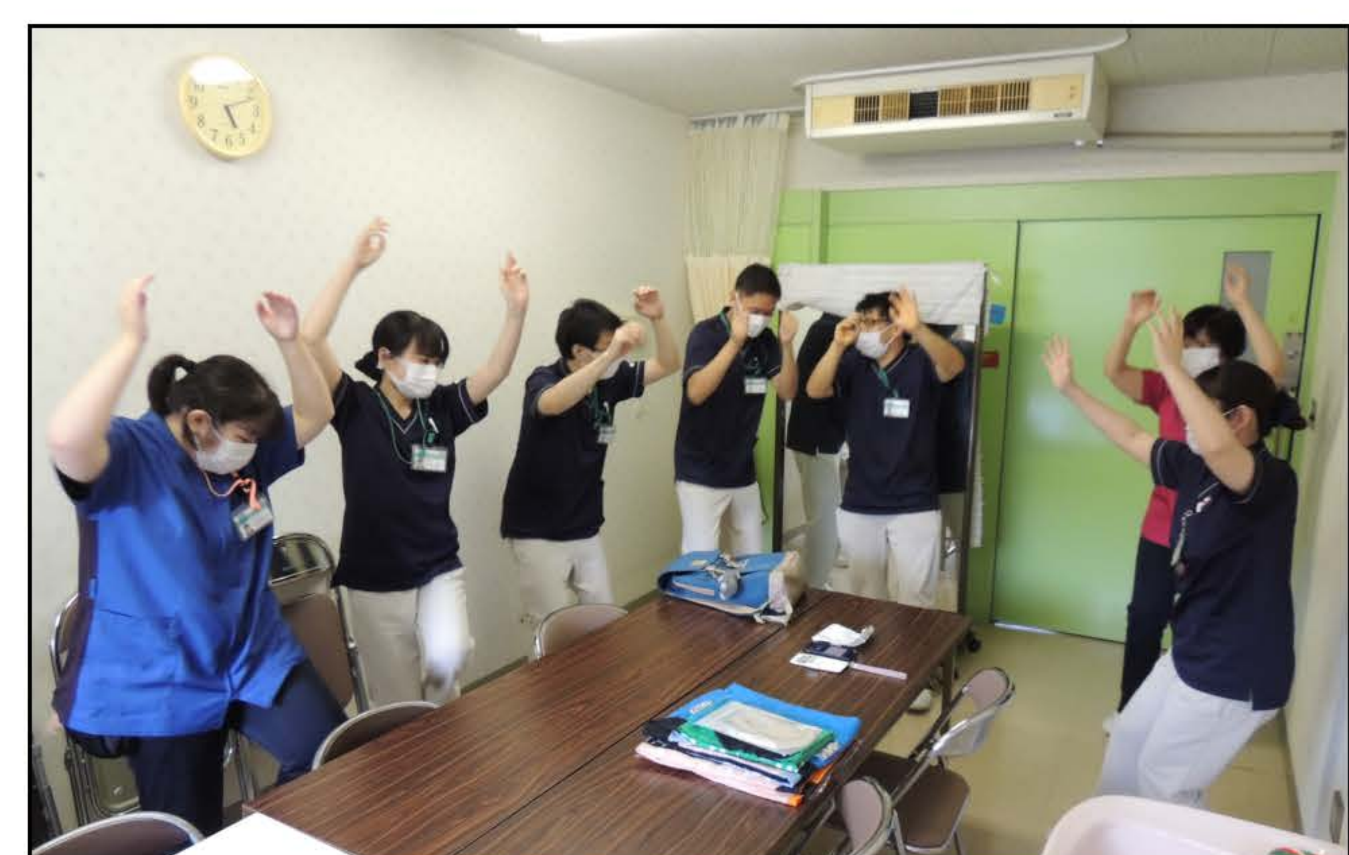
職員有志の練習風景

昨年の阿波踊りは、新型コロナウイルス感染症の影響で戦後初の中止となりました。今年もまだコロナは終息していませんが、阿波踊りの伝統の灯を消さないために