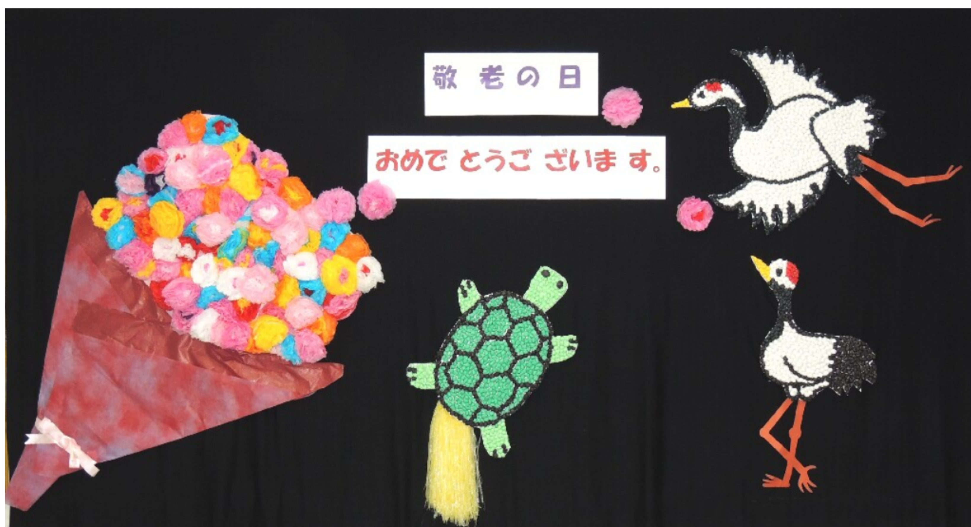
今月の壁画飾りは鶴と亀です