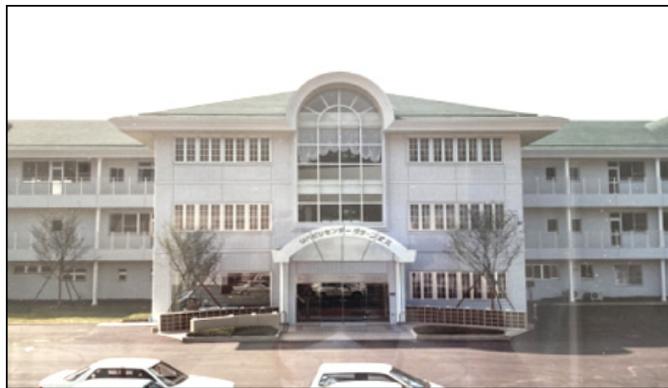
右が現在のグリーン丈六、上が30年前の写真です。玄関脇の欒(けやき)が年月を感じさせます