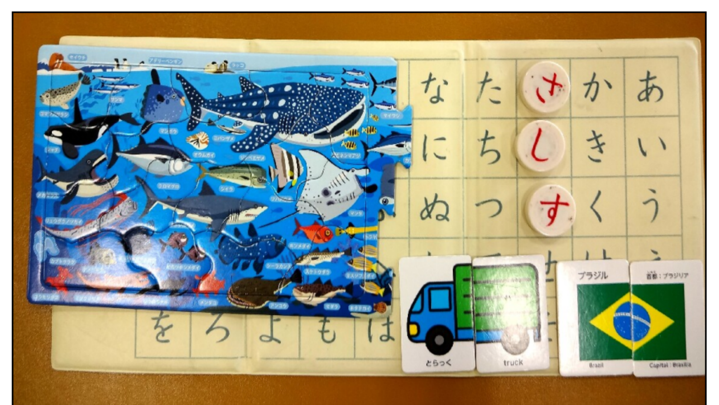
ジグソーパズルや絵合わせの例