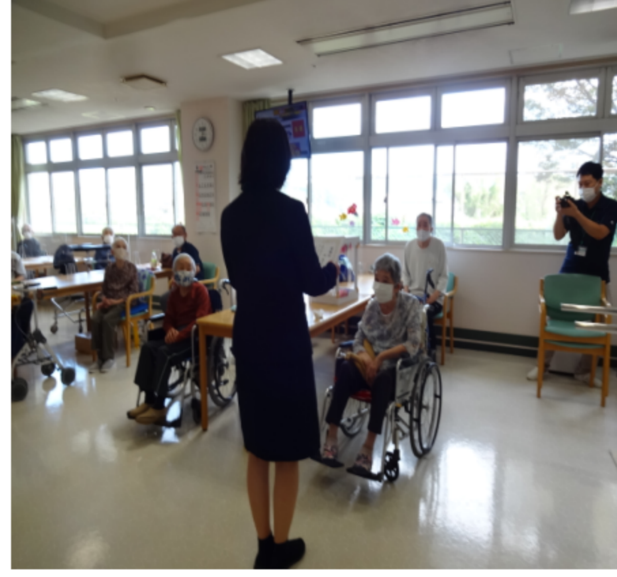
通所リハビリ敬老会の様子