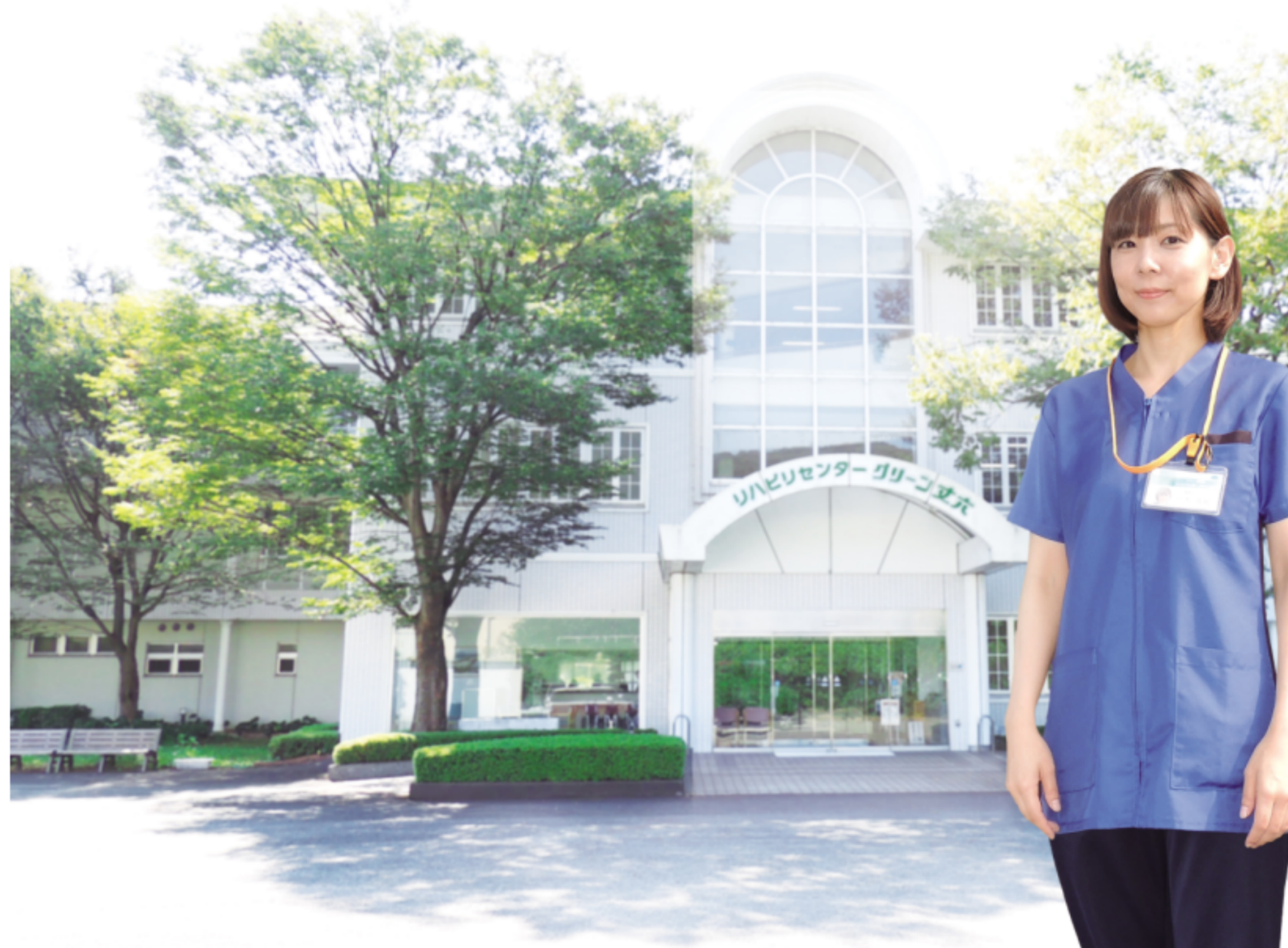
TAOKAメディケアスクール