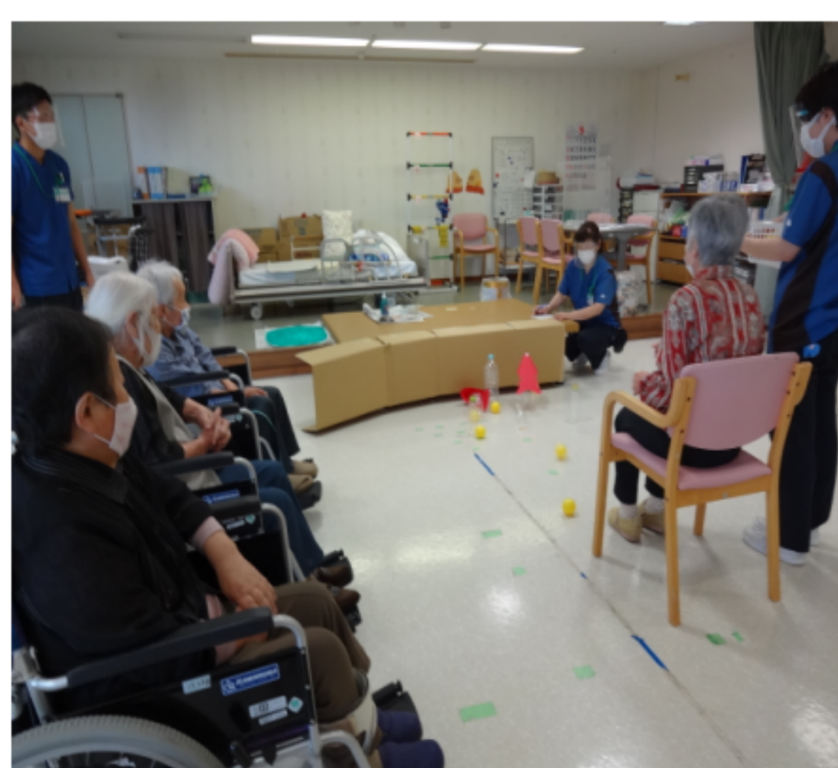
通所リハビリの様子