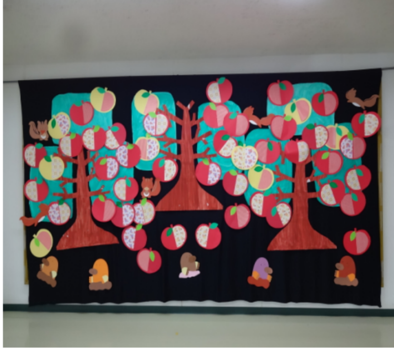
正面玄関ロビーの展示