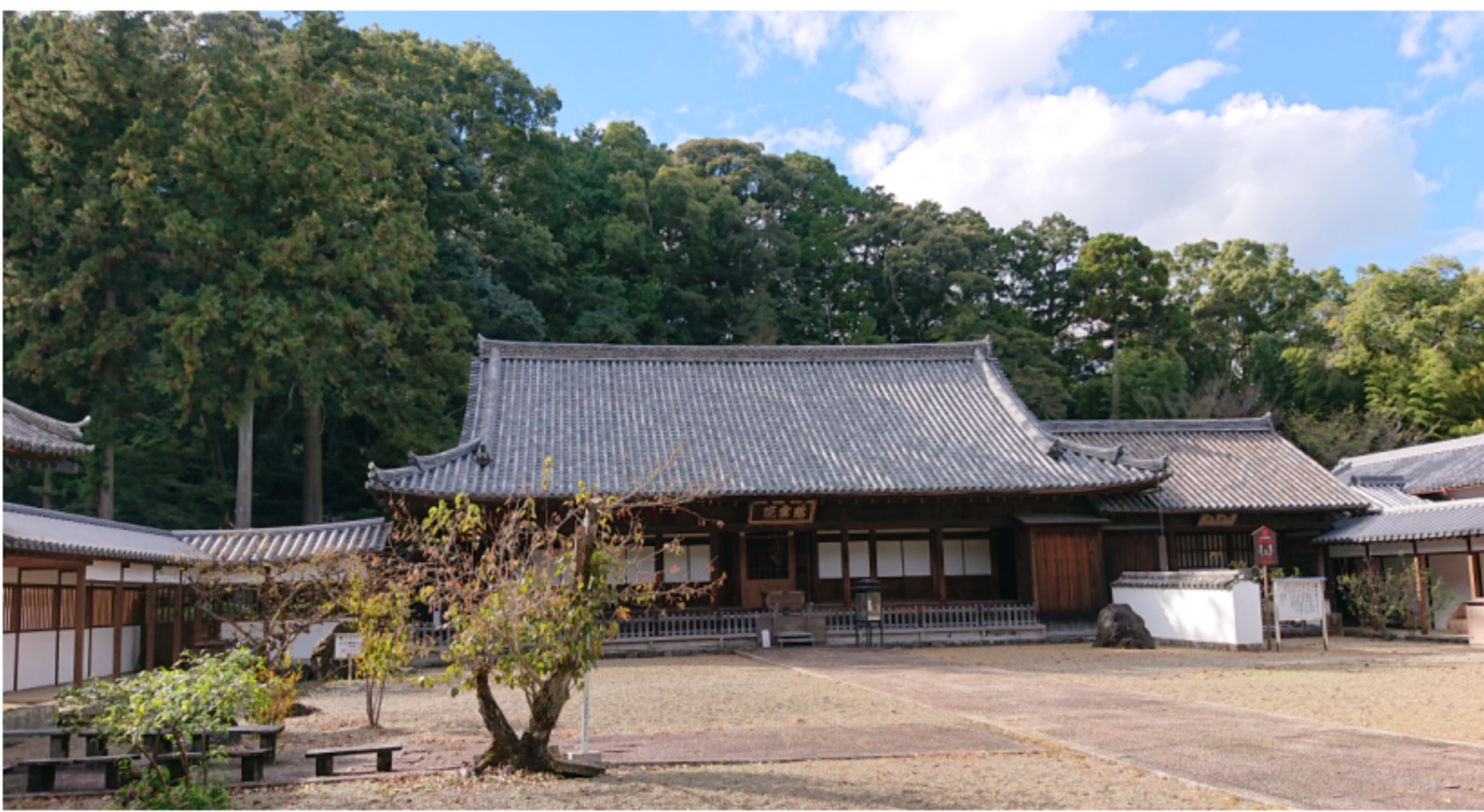
令和3年11月11日 丈六寺本堂の風景