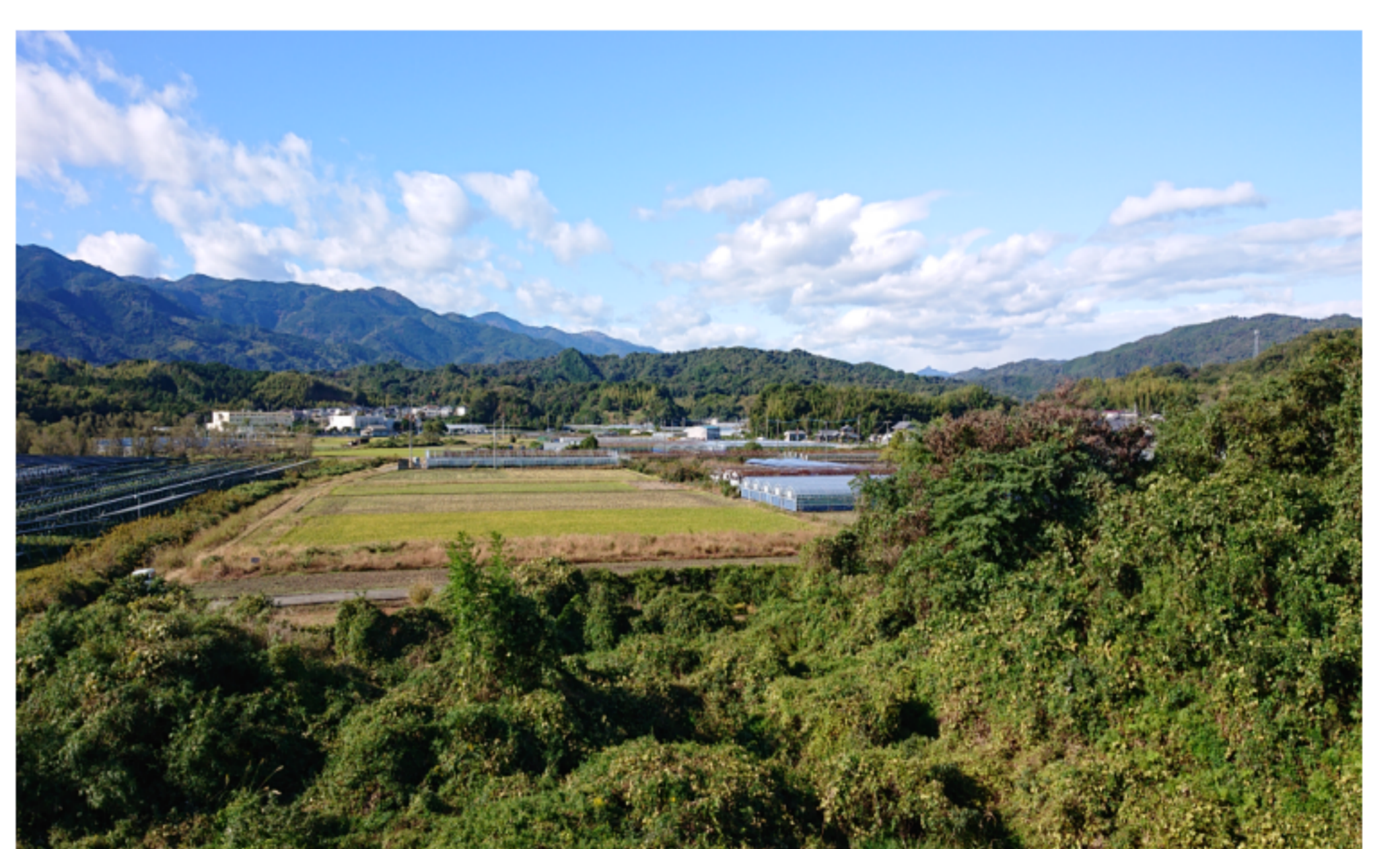
3階リハビリ室から見える風景