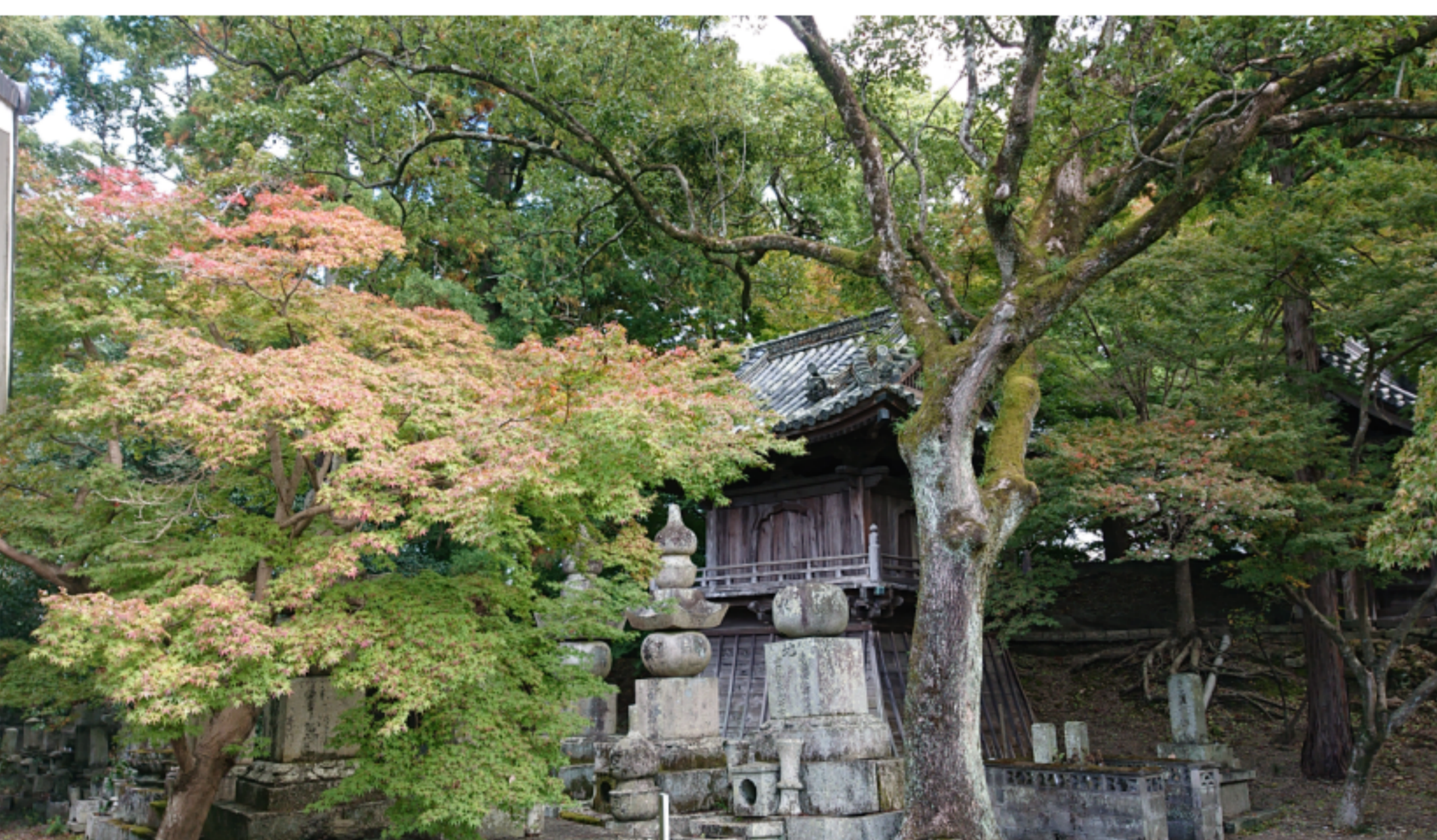
令和3年11月11日 丈六寺参道の風景