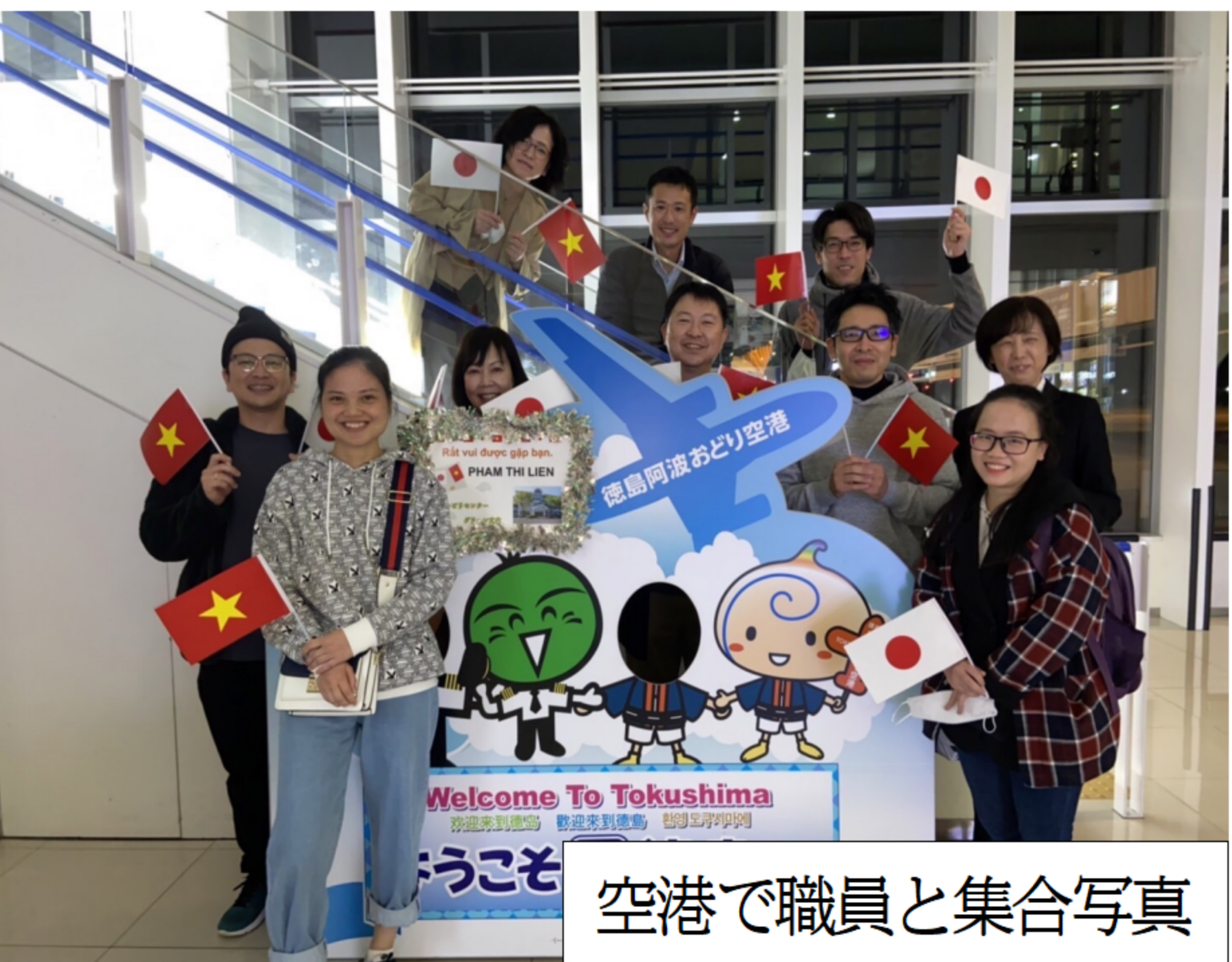
空港で職員と集合写真