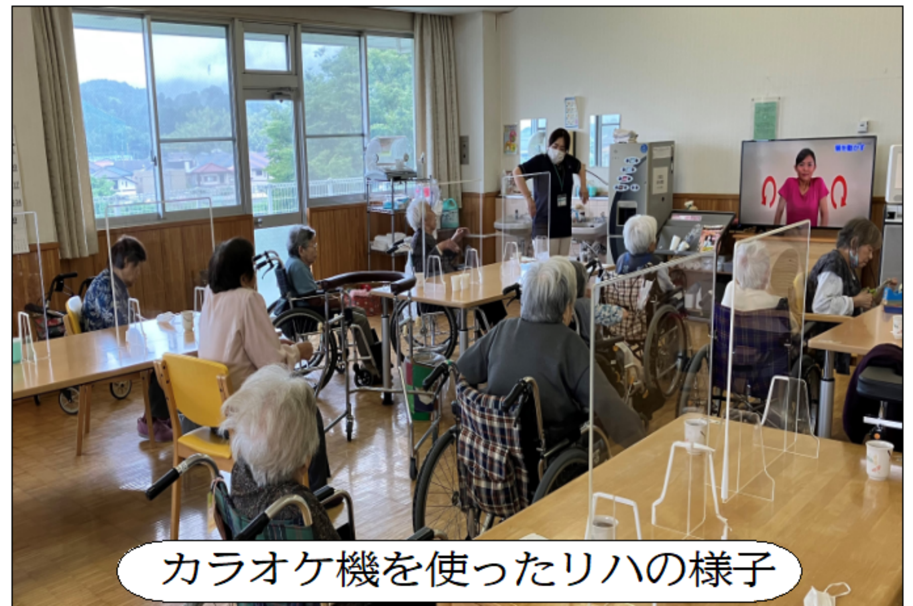
カラオケ機を使ったリハの様子

リハビリでは5月頃からカラオケの機械をレクリエーションや機能訓練に活用しています。歌うだけでなく、誤嚥予防の口腔体操、認知症予