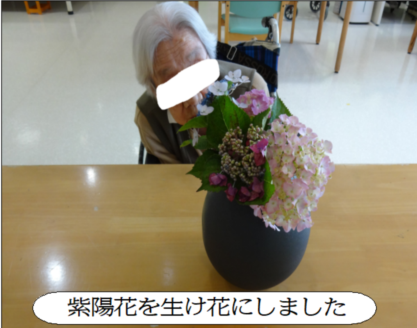
紫陽花を生け花にしました

さて、紫陽花の花言葉をご存じですか？咲いてから散るまでの間に花の色を変えることから「移り気」という花言葉だそうです。最近では花