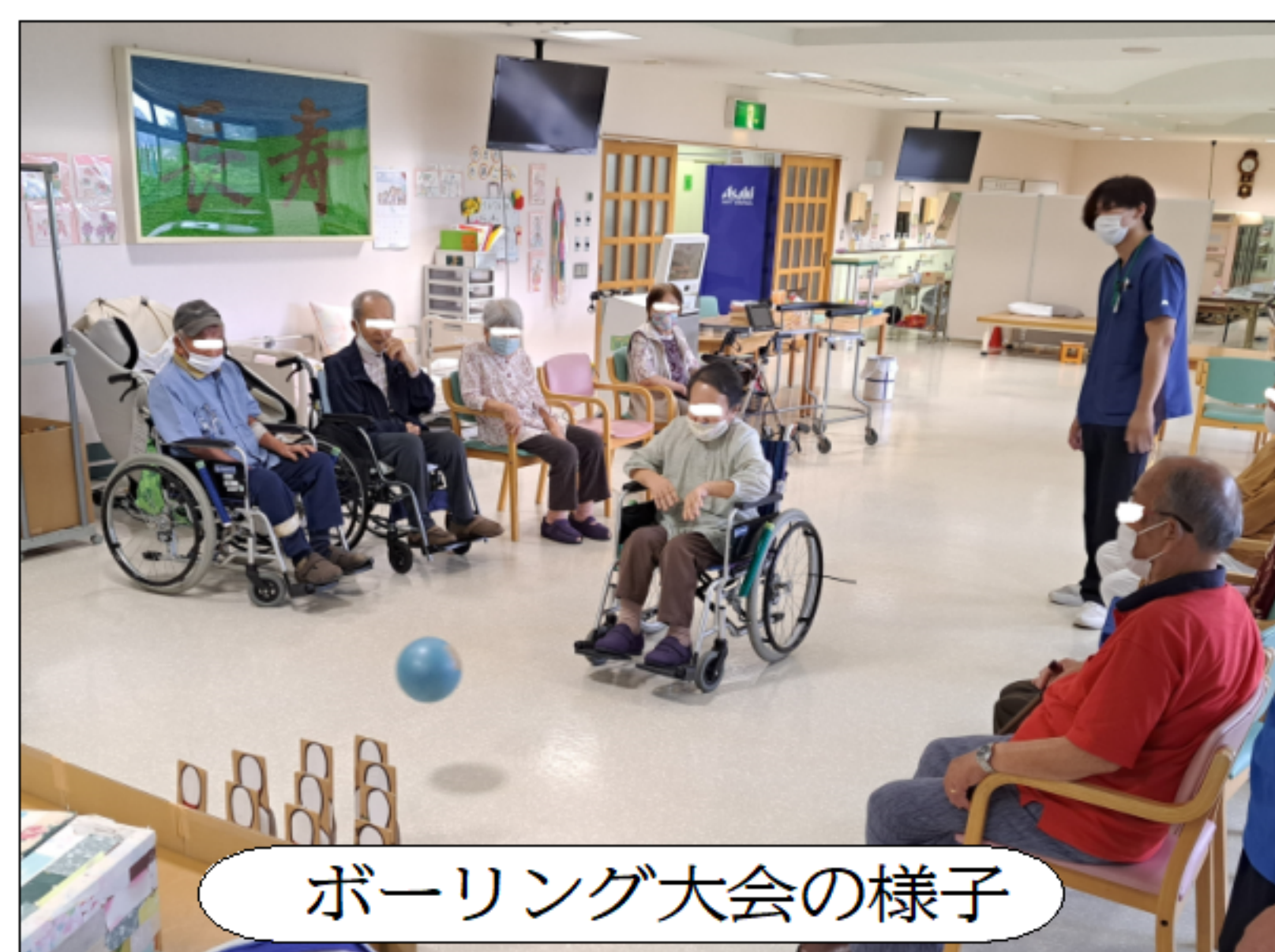
ボーリング大会の様子

通所リハビリでは久しぶりにボーリング大会を行いました。上位入賞の方には景品もご用意いたしました。投げるたびに「いけー！」や「倒れて」など応援の声もあがり、身体を動かす声も張り上げ楽しんでいました。結果が良かった人、少し調子が悪かった方もいらつしやいます。皆様楽しんで頂けたなら職員