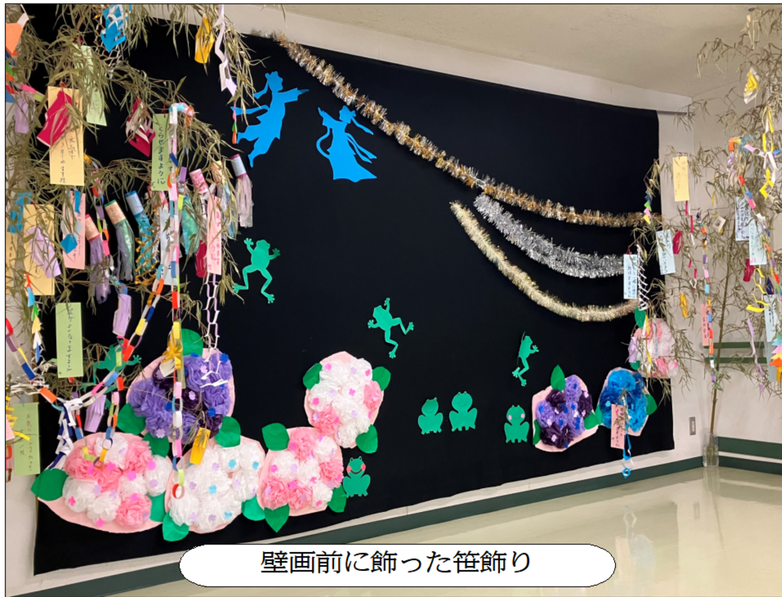
壁画前に飾った笹飾り

七夕とは、天の川に隔てられた織姫と彦星が七月七日の夜、年に一度だけ再会する日。中国伝来の七夕伝説に由来があるとされています。