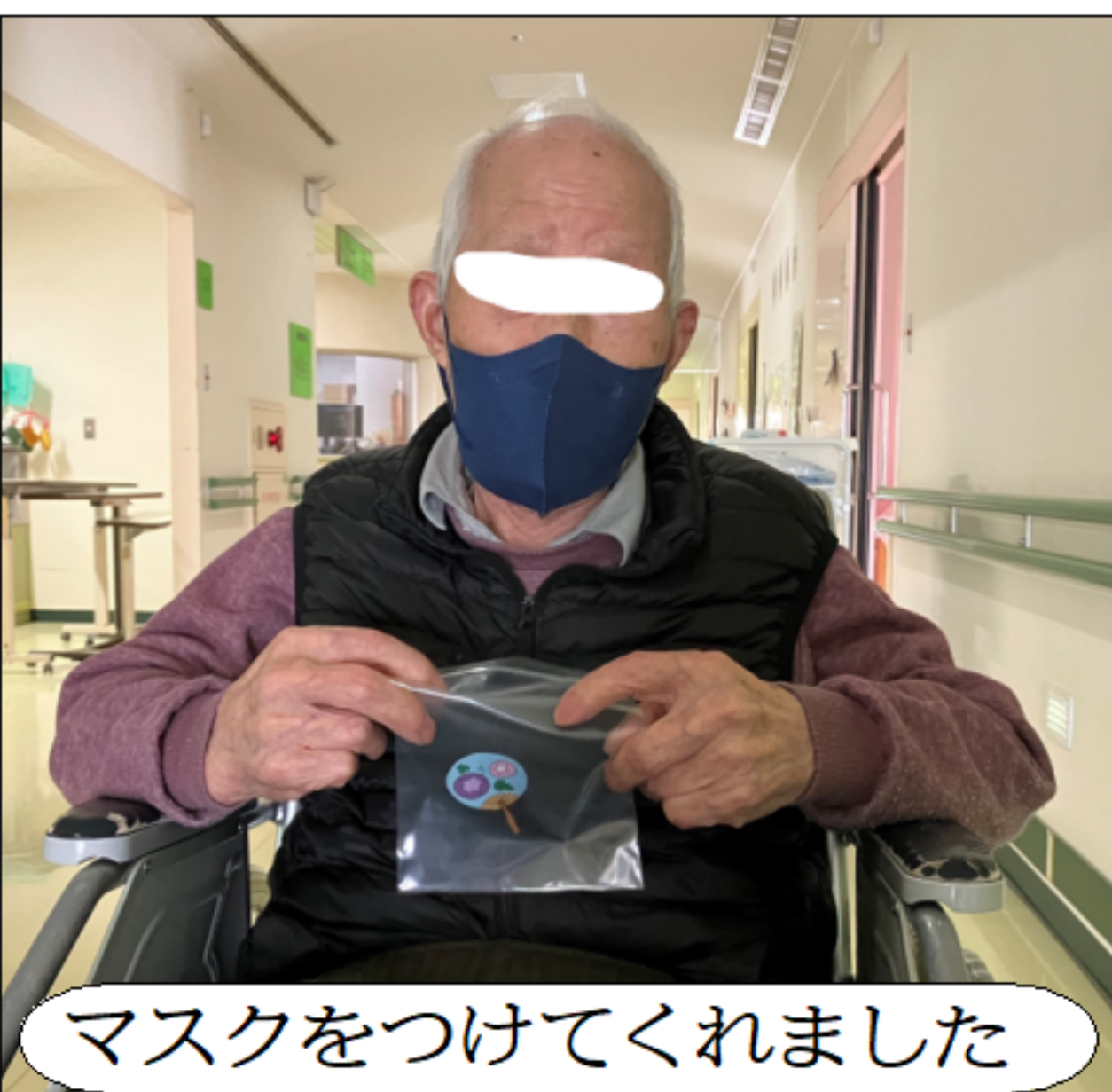
マスクをつけてくれました

日本では幸福や喜びの象徴である黄色がイメージカラーとなり黄色のバラを贈るのが一般的とされています。近年ではお酒やネクタイなど家庭により様々な贈り物が選ばれています。グリーン丈六でも父の日に感謝を込めて行事食の提供・マスクのプレゼントを贈りました。 皆様がいとも健康でいられるよう、職員一同健康管理に気を配り、より良い支援が出来るよう努めます。 (事務部 新濱大輔)