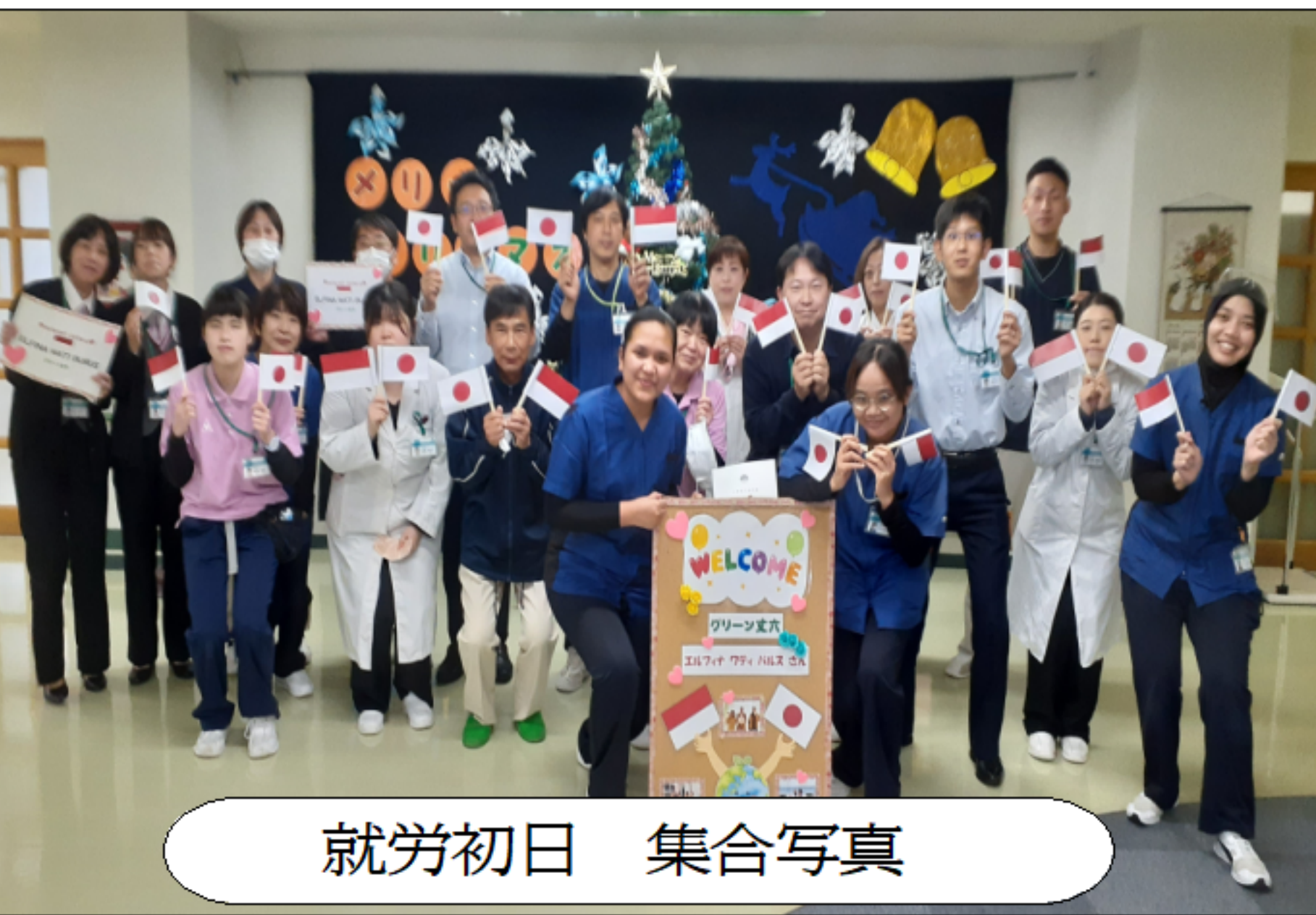
就労初日 集合写真